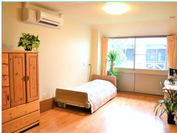
1か月(30日間)の利用料金の目安 R6.8月時点