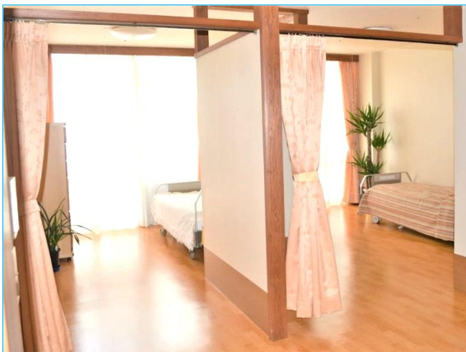
1か月(30日間)の利用料金の目安 R6.8月時点