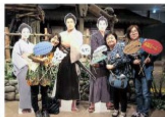
9/26職員旅行2班 in鹿児島 黒豚しゃぶしゃぶと西郷どん