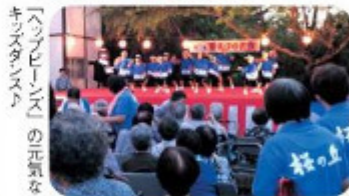
「ハッピーデー」の元気を キリストダンス♪