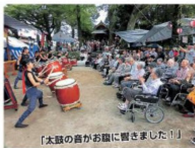
「太鼓の音がお腹に響きました！」