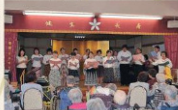
コールさくらのコーラスでお祝い