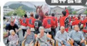
かざり馬と一緒に記念撮影