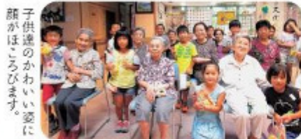
子供達のかわいい姿に顔がほころびます。