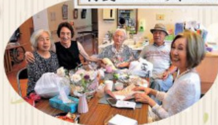
今年101歳になられる皆本様です