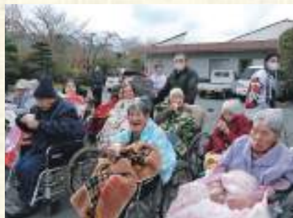
特養 「甘酒美味しいね」