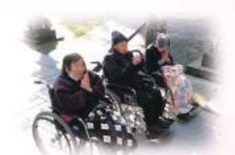
どうぞよい年でありますように…（甲佐神社）