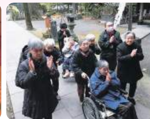
今年も元気に過ごせますように…