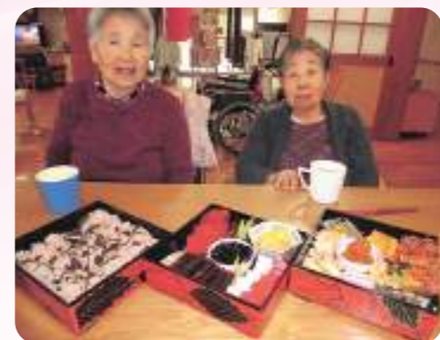
おせち料理が出来ました