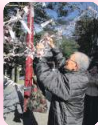
「いい年になってね！」 と願いを込めて