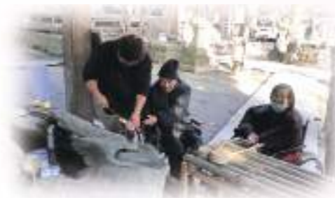
「まず身を清めて…」「冷たかなあ～」