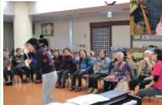
デイサービスでのセッション