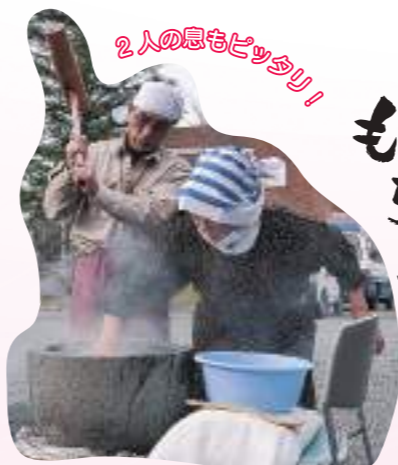
2人の息もピッタリ！

明けましておめでとうございます。 本年もよろしくお願いいたします。 (写真：職員手作りの門松です)