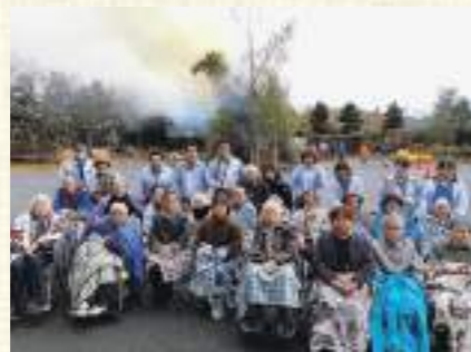
「よかどんどやさんだったね」