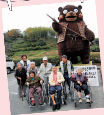
【通潤橋】 ドライブやお買い物にも 出掛け、心も体もリフレッシュ!!