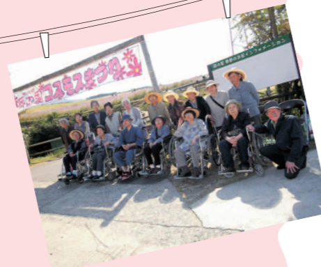
【萌の里】ながめが最高です