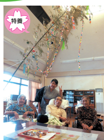
七夕会 立派な飾りが出来ました！