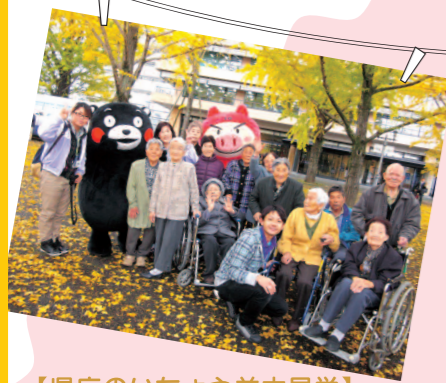
【県庁のいちよう並木見学】 くまモン登場、みな様大喜び