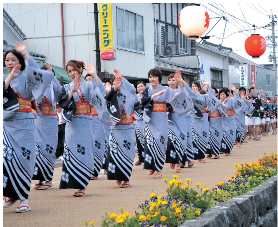
7月28日あゆ祭りで盆踊り大賞をいただきました