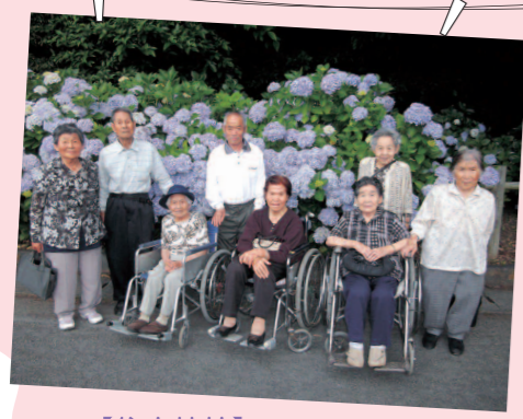
【住吉神社】 毎年恒例のあじさい見物